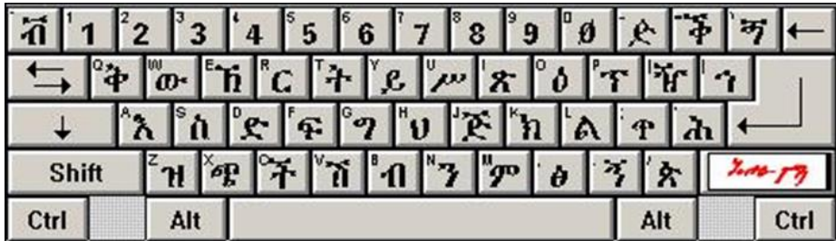
የግዕዝ የኮምፒዩተር ገበታ (US Patent No. 9,000,957 , 9,733,724 )