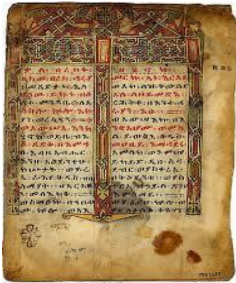
Ms. 2867 Enoch in Ge'ez. Ethiopia, late 15th c.