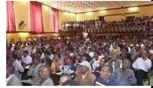
የመቀሌ ሕዝባዊ ስብሰባ

አበተራችሁ ሕዝቡ ፍርዱን እንዲሰጣችሁ ሁኔታዎችን መቻቸልት እንላችኋለን። ባንድ አጅ አብዮታዊ ዲሞክራሲ በሌለው እጃችሁ ሕገ መንግሥቱን ይዛችሁ አታምታቱ። ነፃና ፍትሕዊ ምርጫ አካሂዱ» ብለዋቸዋል።